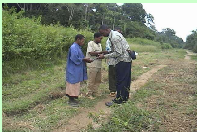
Formation des cartographes des communautés en manipulation des unités GPS

La deuxième série de cartes pour les demandes foncières sera complétée en mi-2005. Les cartes seront ensuite utilisées par les communautés pour approfondir leur analyse et aboutiront à des cartes finales d'usage foncier et des liens historiques et culturels qu'ont les communautés avec la forêt. Il en aboutira également une « étude de cas 10c », qui sera finalisée en 2006. La deuxième série de cartes pour les demandes foncières sera entreprise dans la partie est du Parc National de Campo Ma'an. Ceci complètera le travail que CED a commencé avec les Bagyéli dans la zone.