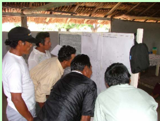
Membres du village de Sawariwa'o vérifient une carte communautaire du sous district de South Central, février 2005

Au début de 2005, les communautés ont commencé à travailler sur l'élément « étude de cas 10c » du projet, qui sera complétée en juillet.