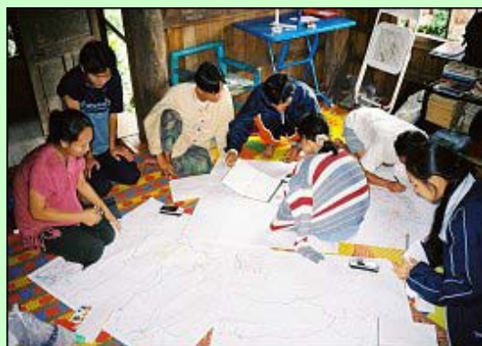
Formation: Tracé du modèle de carte sur papier

En octobre et novembre 2004, FPP a organisé des ateliers intensifs avec les stagiaires de l'« étude de cas 10c » relatifs aux activités et la mise en oeuvre de la deuxième phase du projet. Les stagiaires et FPP ont développé ensemble un processus et un format clair et compréhensible pour la poursuite des entretiens et le recueil d'informations.