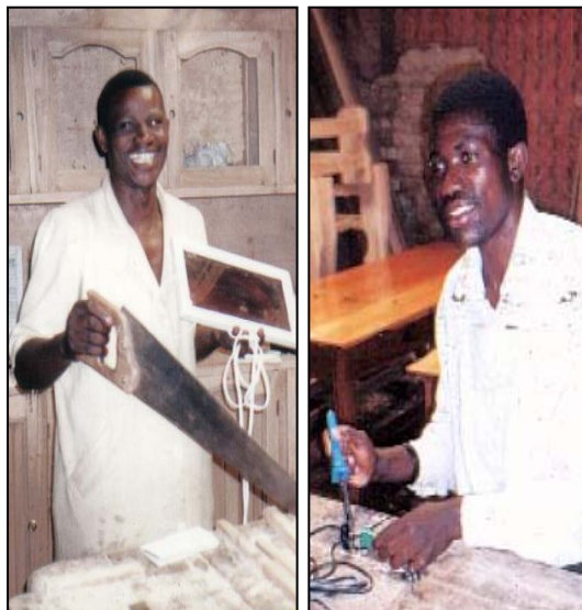
Techniciens du PIDP spécialisés en menuiserie et en électricité répartissent les tâches de montage

Dans la pratique, la majorité des tâches à effectuer pour le montage des technologies DIY Solar proposées sont simples et facile à comprendre. Le montage des technologies DIY se compose de tâches 'manuelles' et repose donc sur une 'technologie légère' requérant des compétences humaines plutôt que sur une 'technologie lourde' requérant des outils. En outre, comme l'ensemble du montage des technologies comporte différentes tâches, il peut être entrepris par des ouvriers/artisans ayant des compétences et capacités différentes et travaillant en équipe. Par exemple, un menuisier pourrait préparer les cadres pour les modules solaires, un électricien pourrait raccorder les blocs-piles et le montage même des modules et des blocs-piles pourrait être effectué par des personnes n'ayant pas reçu de formation, qui sont tout simplement bonnes de leurs mains et capable de faire attention aux détails.