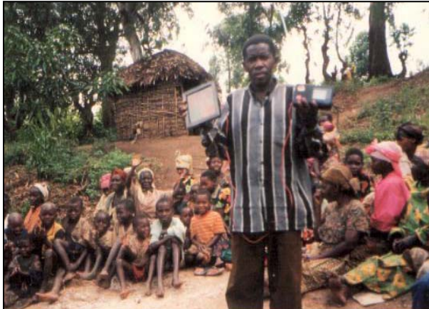
Le chef de la communauté bugarula démontre comment 'brancher ses habitants sur le soleil'

Pour la majorité des familles batwa, le soir, la flamme nue est leur source de lumière – la lueur rougeâtre du feu de cuisson du repas du soir. Le manque d'argent pour acheter régulièrement des bougies en est la raison, sans parler d'investir dans une lampe à pétrole et d'acheter de la paraffine. Les flammes nues dont se servent les Batwa pour s'éclairer sont faibles, dangereuses et font de la fumée, posant un risque d'incendie, un risque pour leur santé en aspirant de la fumée, et un risque de se brûler pour ceux qui se groupent autour des feux de cuisson.