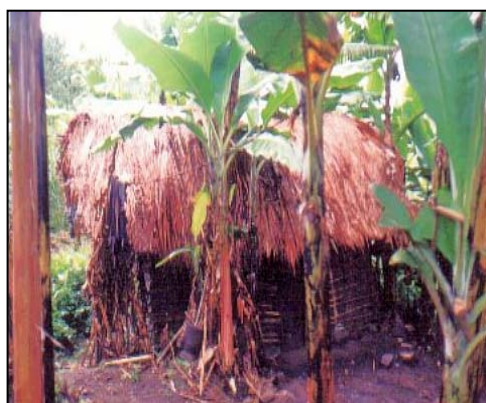
Maison batwa traditionnelle – île de Idjwi, RDC

Le peuple autochtone batwa « pygmées » vit dans la région des Grands Lacs en Afrique centrale. Les Batwa constituent un groupe particulièrement vulnérable et défavorisé et sont parmi les plus pauvres d'une population déjà appauvrie. En tant que peuple autochtone, pour la plupart d'anciens habitants des forêts qui vivaient de chasse et de cueillette, les Batwa sont depuis longtemps non intégrés au reste de la société et sont victimes d'une discrimination sociale, économique et politique marquée 3 .