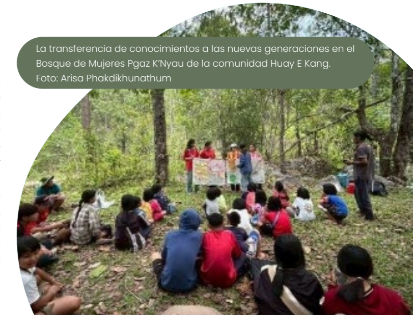
La transferencia de conocimientos a las nuevas generaciones en el Bosque de Mujeres Pgaz K'Nyau de la comunidad Huay E Kang.