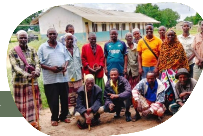
Reunión comunitaria el 15 de julio de 2025 para debatir temas de mantenimiento de la paz, preservación cultural y defensa del territorio.

Con el apoyo de LMPD y otros, las comunidades Aweer y Sanye están aumentando su participación en la incidencia de derechos a la tierra y la conservación. Además, están poniendo presión para que se registren sus tierras y se reconozcan sus territorios tradicionales, posiblemente como TIT o TICCA. Sin embargo, su participación se ve limitada por la falta de reconocimiento legal de los derechos de sus comunidades sobre la tierra, las restricciones al acceso a los bosques y la falta de una participación significativa en los programas de conservación gestionados por el Estado.