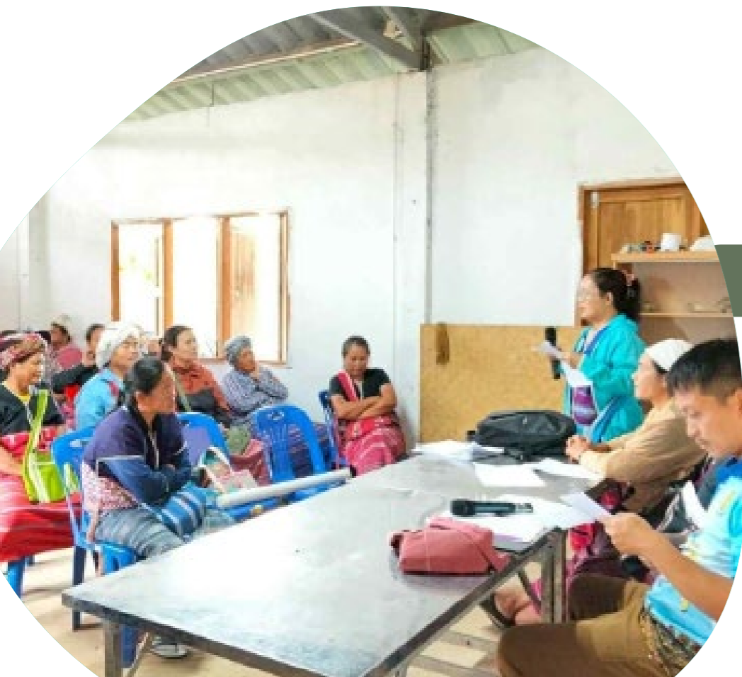
Reunión para revisar las normas de la comunidad de Huay E Kang.

El reconocimiento de los TIT como una vía independiente honra el liderazgo y los derechos de los pueblos indígenas y garantiza que la Meta 3 se implemente de manera sostenible, basada en los derechos y arraigada en la cultura. Pero este reconocimiento también apoya a los gobiernos en la implementación y el logro de la Meta 3, lo que significa que los gobiernos pueden incluir los esfuerzos de las comunidades en sus informes nacionales.