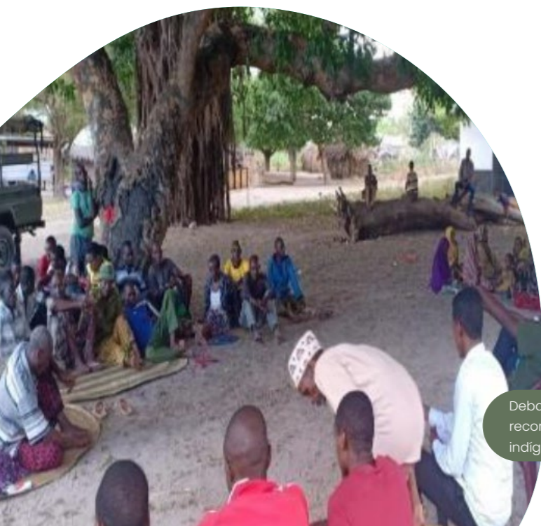
Debate comunitario sobre las opciones para el reconocimiento de la conservación dirigida por indígenas en julio de 2025.

A pesar de nuestras contribuciones, el pueblo Wapichan se enfrenta a amenazas cada vez mayores por parte de las industrias extractivas y las presiones externas. Los proyectos mineros, madereros y de infraestructura a menudo tienen una