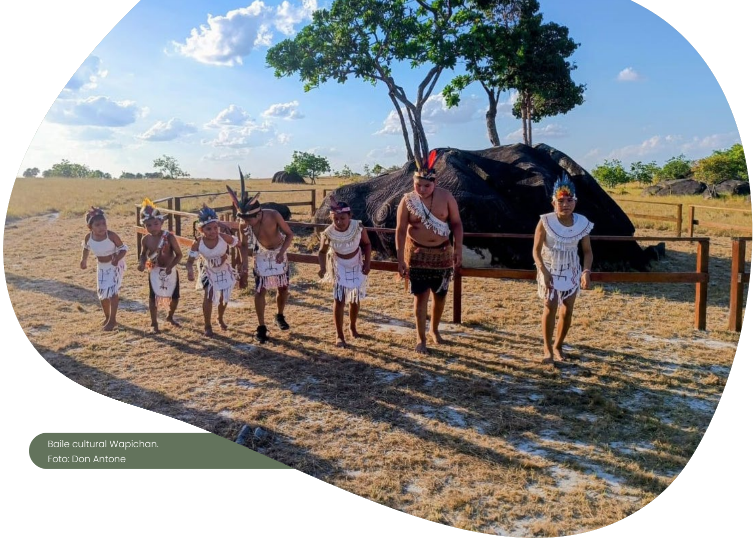
Baile cultural Wapichan.