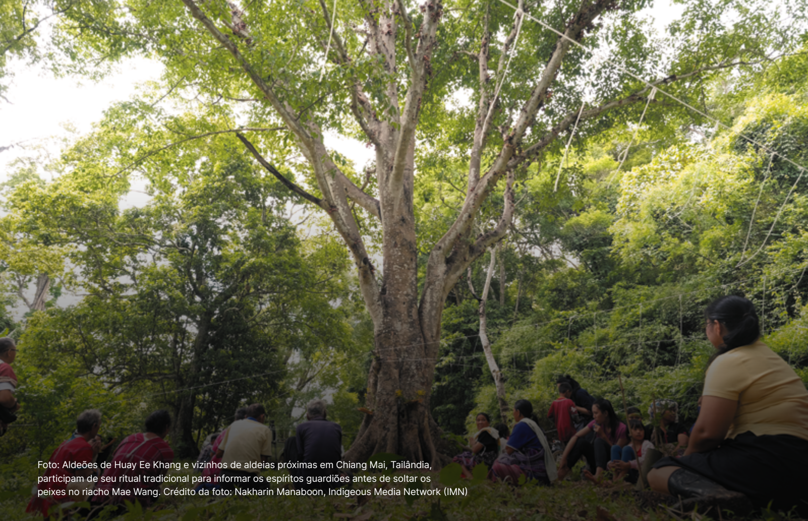
Foto: Aldeões de Huay Ee Khang e vizinhos de aldeias próximas em Chiang Mai, Tailândia, participam de seu ritual tradicional para informar os espíritos guardiões antes de soltar os peixes no riacho Mae Wang.

Na prática, os direitos dos povos indígenas são só respeitados se o seu povo for capaz de dar, ou negar, o seu CLPI sobre suas terras, e o carbono nelas armazenado, e decidir se devem ser incluídos em qualquer projeto ou programa de crédito de carbono. Dado que os povos indígenas têm direito à autodeterminação (o que significa que devem ser capazes de decidir como deverá ser o seu futuro político, económico, social e cultural), vocês devem ser parceiros no desenvolvimento e concepção de projetos ou programas de carbono desde o início.