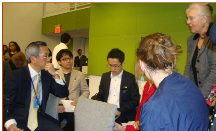
Caucus de los Pueblos Indígenas debatiendo con la delegación japonesa el mensaje clave de estos pueblos sobre el pilar cultural

En Nueva York se está debatiendo un proyecto de documento de negociación, el denominado "borrador cero", en reuniones mensuales. El documento no define claramente metas y acciones vinculantes para los gobiernos y para el sector privado, ni identifica la necesidad de adoptar reglas vinculantes para este último. Por si eso fuera poco, los elementos clave, como dar un enfoque "basado en los derechos" al desarrollo y las cuestiones sociales y ambientales, corren el riesgo de perderse entre las divergentes agendas gubernamentales. Los compromisos de abordar cuestiones que afectan a múltiples sectores, como la justicia económica y una reforma profunda del sistema financiero, corren el mismo riesgo.