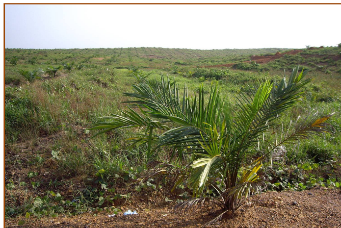
Tierras consuetudinarias desmontadas y plantadas de palmas de aceite sin el consentimiento libre, previo e informado de la comunidad. Además de la tierra utilizada para producir alimentos y obtener materiales de construcción, a la derecha de la fotografía se puede ver una zona de enterramiento que ha sido desmontada y plantada, y a la izquierda (fuera de la imagen) hay un bosque sagrado de las mujeres, el cual también fue desmontado y plantado en su mayor parte.

En una conferencia de prensa celebrada a principios de septiembre de 2011 las comunidades locales de Grand Cape Mount, Liberia, denunciaron que el conglomerado malayo Sime Darby se había apoderado de sus tierras y las había arrasado para producir aceite de palma. Las comunidades locales presentaron una denuncia formal ante la RSPO a través del Forest Peoples Programme (Programa para los pueblos de los Bosques) y un representante legal elegido por ellas mismas: Green Advocates. En respuesta, Sime Darby congeló sus operaciones en la zona en disputa y, a través de la secretaría de la RSPO, accedió a mantener negociaciones bilaterales con las comunidades para resolver sus diferencias.