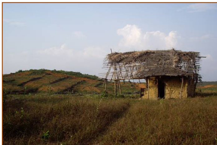
Restos de una casa abandonada en una plantación de palma de aceite de Sime Darby. Un pozo de agua cercano y restos de caña de azúcar, plataneros y tilos que crecen entre las palmas de aceite jóvenes demuestran el uso y la ocupación anterior por parte de las comunidades.

La concienciación sobre los efectos sociales y ecológicos de la expansión de los agronegocios en el sudeste de Asia ha conducido a nuevas normas de desarrollo aceptable del negocio del aceite de palma. La Mesa Redonda sobre el Aceite de Palma Sostenible (RSPO por sus siglas en inglés), un proceso de certificación voluntaria por una tercera parte, ha adoptado una serie de principios y criterios que son esencialmente coherentes con un enfoque basado en los derechos, y con los que se pretende desviar la expansión del negocio del aceite de palma de los bosques vírgenes y las zonas de alto valor para la conservación, prohibiendo al mismo tiempo la ocupación de tierras consuetudinarias sin el consentimiento libre, previo e informado (CLPI) de las comunidades locales. El cumplimiento de la norma de la RSPO se está convirtiendo en un requisito para acceder al mercado europeo, y los principales conglomerados productores de aceite de palma que quieren conservar su cuota de mercado se han hecho socios de la RSPO.