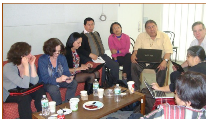
Reunión del Caucus de los Pueblos Indígenas durante el período entre sesiones

http://www.un-redd.org/REDD_and_Green_Economy/tabid/55607/Default.aspx