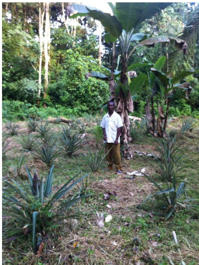
Membre d'une communauté dans une plantation d'huile de palme

Le FPP les appelle à améliorer leur approche. Les efforts de conservation de la forêt ne peuvent aboutir si le gel de terres forestières s'associe à des « accaparements de terres ». Les entreprises doivent plutôt commencer par respecter les droits fonciers des communautés, assurer leurs moyens de subsistance, et clarifier dès le