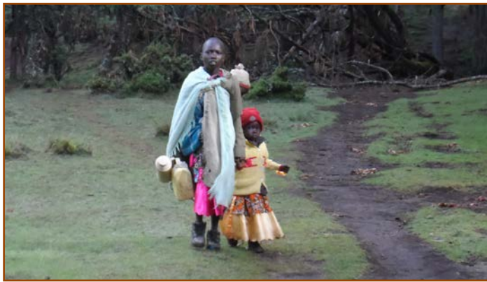
Enfants fuyant des gardes armés - Embobut, Kenya 2014

Le commissaire du comté (qui semble avoir joué un rôle central dans la coordination des expulsions avec le KFS, le ministère auquel il est rattaché, et la police) a confirmé que des maisons sont brûlées et que le gouvernement continuera à chasser de l'écosystème chaque personne installée illégalement, et est allé jusqu'à déclarer : « Cela peut sembler mal et primitif de brûler des maisons, mais messieurs, regardez, nous devons faire face à la réalité dans cette situation, et dire à notre peuple que l'accès à la forêt est dorénavant interdit ». 9