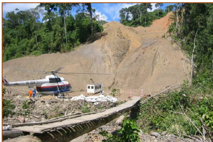
Tracé du gazoduc de Camisea, vallée de Urubamba