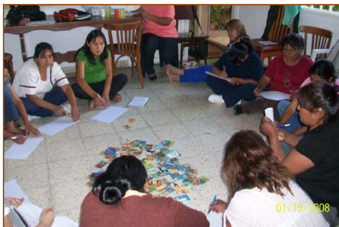
Atelier à Jujuy, Argentine