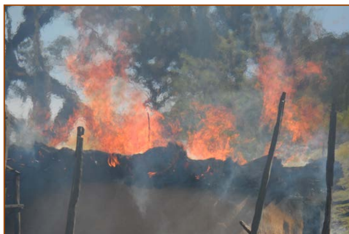
Membre de la communauté sengwer : « Tous les uniformes scolaires des enfants, nos ustensiles de cuisine, nos récipients d'eau, nos tasses, ont été brûlés. Il n'y a eu aucune consultation ».

Nous assistons probablement ici à l'aboutissement du bras de fer opposant d'une part les efforts de la société civile pour enraciner les droits humains dans la Constitution kenyane de 2010 et à aboutir à la reconnaissance des droits communautaires dans le projet de loi sur les terres communautaires, et d'autre part la détermination d'une élite à s'approprier les terres communautaires sans tenir aucun compte de la constitution, et avant que le projet de loi sur les terres communautaires se concrétise.