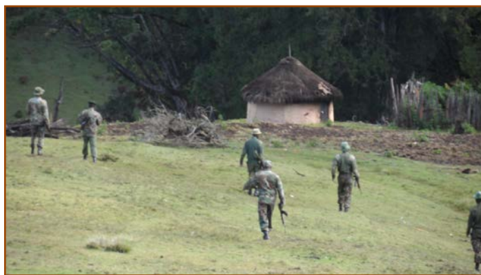
Gardes s'approchant d'une maison, Embobut, Kenya 2014

Embobut, où le Président a promis 400 000 shillings kenyans par famille vivant à Embobut pour ceux qu'il a appelés les « expulsés » des forêts. 3 À aucun moment les Sengwer n'ont-ils été consultés de façon significative concernant cette nouvelle proposition de réinstallation, et leur consentement libre, préalable et éclairé n'a été ni demandé ni obtenu. De plus, un représentant du gouvernement a informé les résidents de la communauté Sengwer que l'argent proposé constituant plutôt une compensation pour leurs souffrances passées 4 , ils pourraient accepter la somme tout en demeurant là où ils vivaient. Certains Sengwer auraient refusé d'inscrire leur nom sur les listes permettant de percevoir l'argent, tandis que d'autres se sont inscrits mais n'ont jamais perçu l'argent. Dans tous les cas, aucun de ceux inscrits n'a signé de document confirmant leur consentement à quitter la forêt. L'on peut raisonnablement supposer que ceux s'étant inscrit sans savoir qu'ils pouvaient obtenir l'argent et rester l'ont fait en croyant qu'ils seraient presque certainement expulsés quoi qu'il en soit. En résumé, les Sengwer n'ont pas été adéquatement consultés, et il ne leur a pas été laissé de choix significatif quant à leur réinstallation.