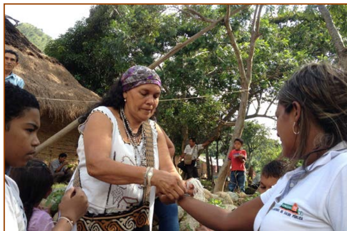
Femme kankuama – Communauté chemesquemena – atelier sur les droits en matière de sexualité et de procréation

Le projet a été mené sur plus de sept ans. Au cours de cette période, les organisations ont travaillé tour à tour sur des droits spécifiques, notamment : le droit à l'éducation (Argentine) ; le droit des femmes à une vie à l'abri de la violence dans le contexte des conflits armés (Colombie) ; le droit à la santé (Mexique) ; et le droit à l'identité (Canada). Les actions étaient ciblées sur les points principaux suivants : consolidation de la sensibilisation aux droits, politiques publiques, études/documentation, actions en justice et plaidoyer. Les